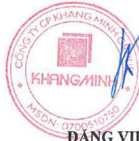
ĐẶNG VIỆT LÊ